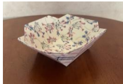
イメージ見本 (サイズ約14×14×6cm) 色柄は選べません。